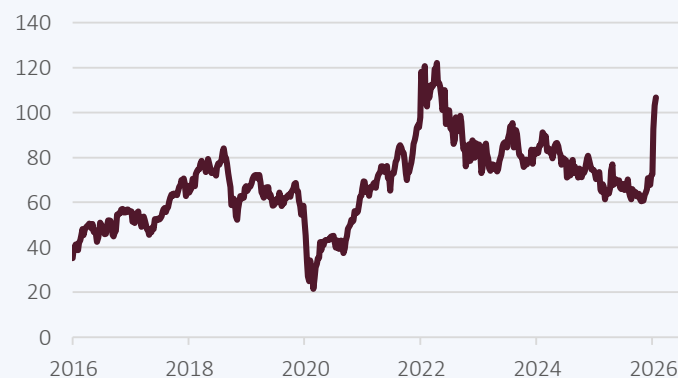
Grafik 4: Ölpreisentwicklung der letzten 10 Jahre

Quelle: Bloomberg, Belvalor; ICE Brent Crude, USD pro Fass, 20.03.2016 - 20.03.2026