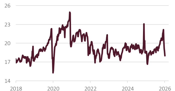
Grafik 2: Kurs-Gewinn-Verhältnis Swiss Performance Index

Basis: monatlich; Gewinne: Konsensschätzungen für kommende 12 Monate, SPI Index, 01.01.2018 - 19.03.2026